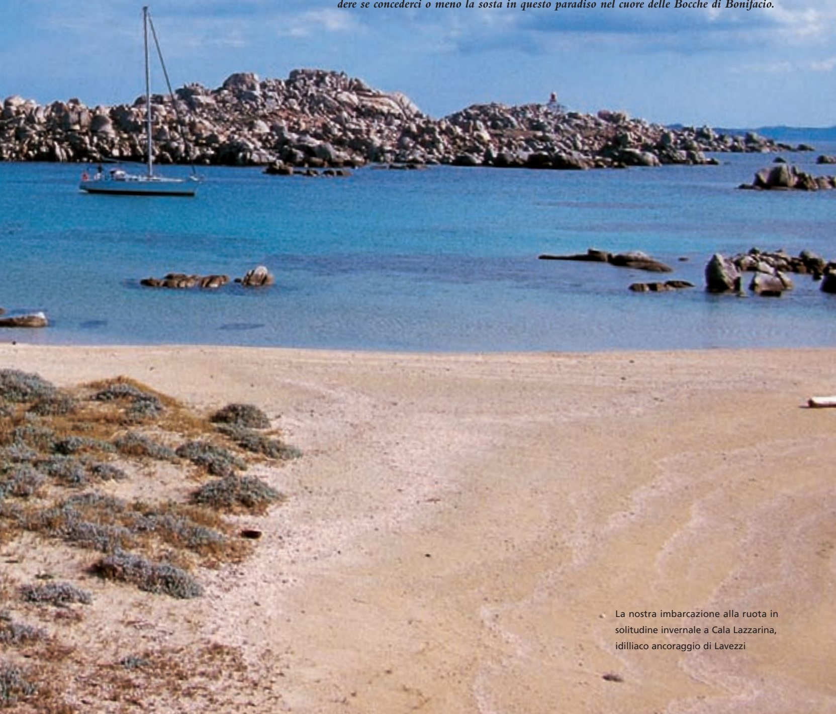
La nostra imbarcazione alla ruota in solitudine invernale a Cala Lazzarina, idilliaco ancoraggio di Lavezzi